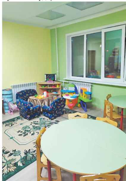
На фото: д/с п.Янчукан до и после ремонта