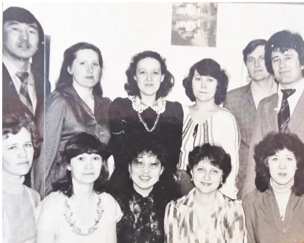
На фото: Коллектив Музыкальной школы, 1983 год